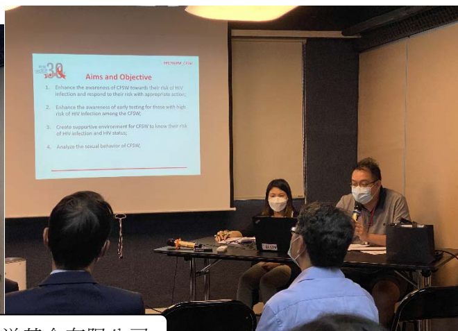
探訪關懷愛滋基金有限公司