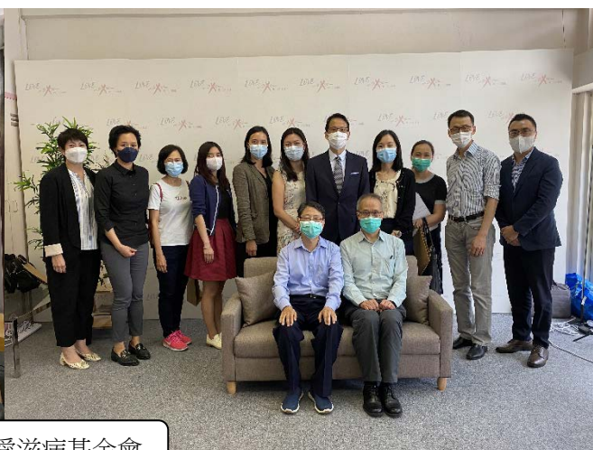
探訪香港愛滋病基金會