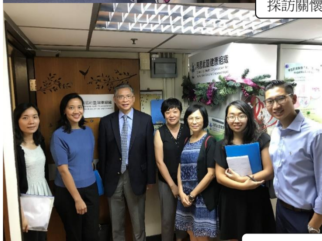
探訪再思社區健康組織