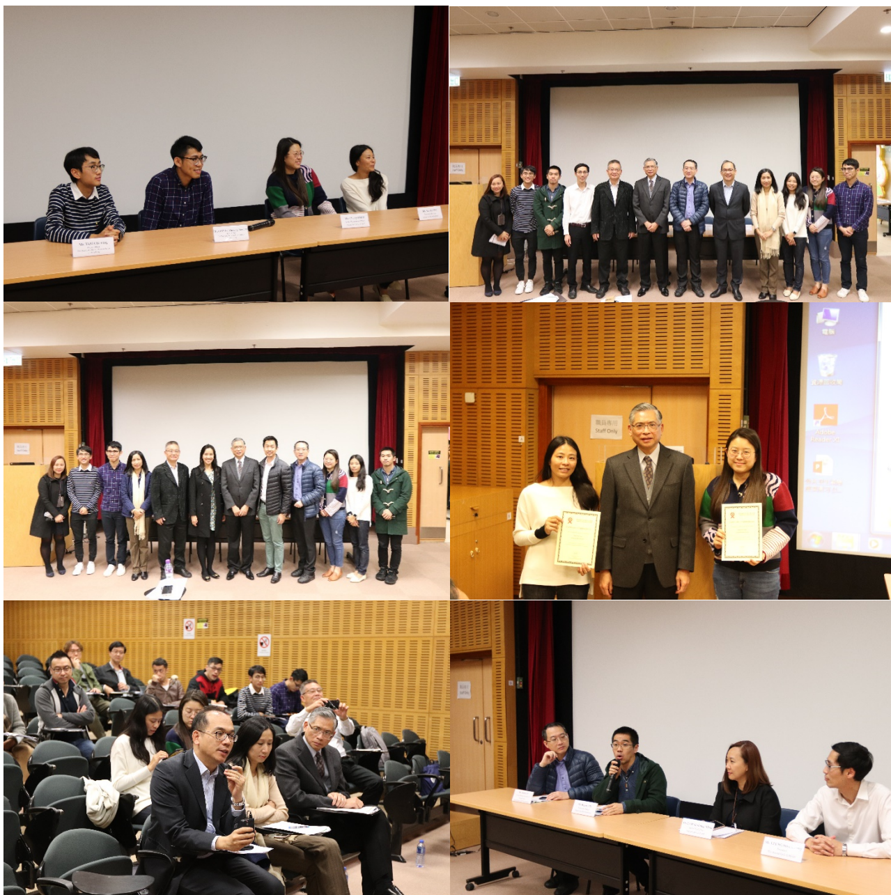
2019年1月11日經驗交流會

愛滋病信託基金於 2019 年 1 月 11 日舉辦了一場經驗交流會。該經驗交流會為獲撥款機構提供平台，以分享如何透過基金資助的計劃，在優先關注社羣中預防和控制愛滋病，以及進行愛滋病相關研究的成果。