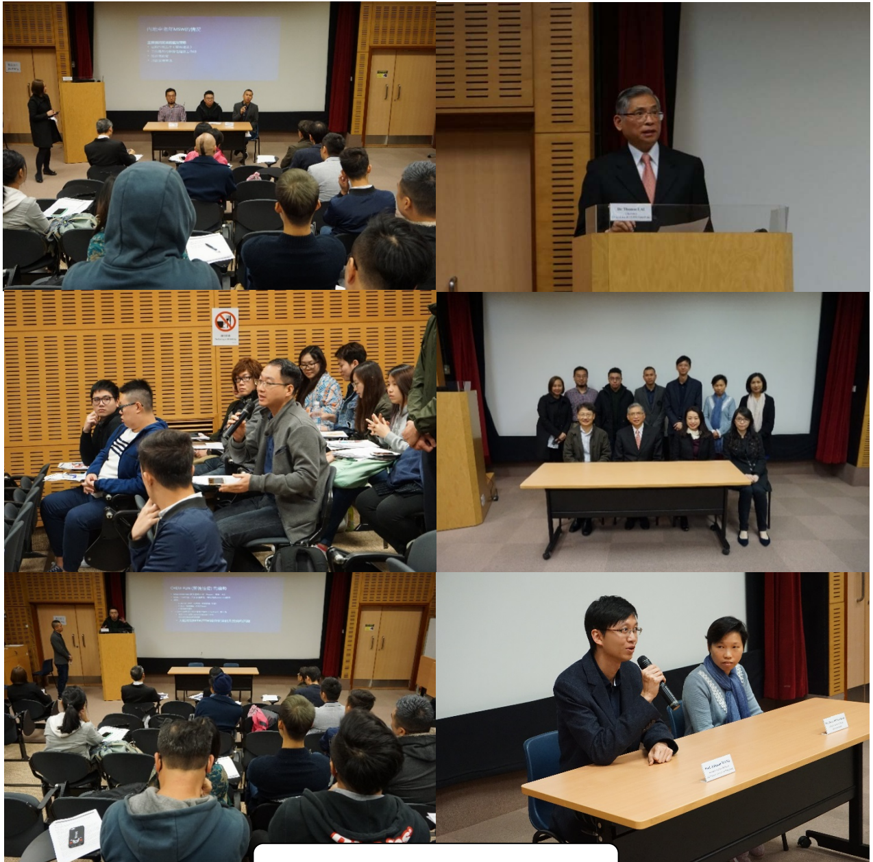
2017年12月5日經驗交流會

愛滋病信託基金於 2017 年 12 月 5 日舉辦了一場經驗交流會。該經驗交流會為獲撥款機構提供平台，以分享如何透過基金資助的計劃，在優先關注社羣中預防和控制愛滋病，以及進行愛滋病相關研究的成果。