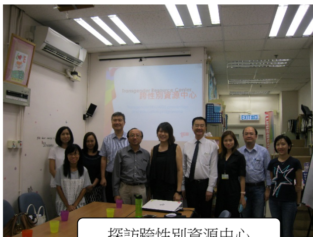
探訪跨性別資源中心