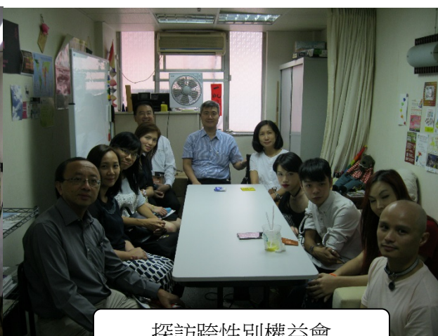
探訪跨性別權益會